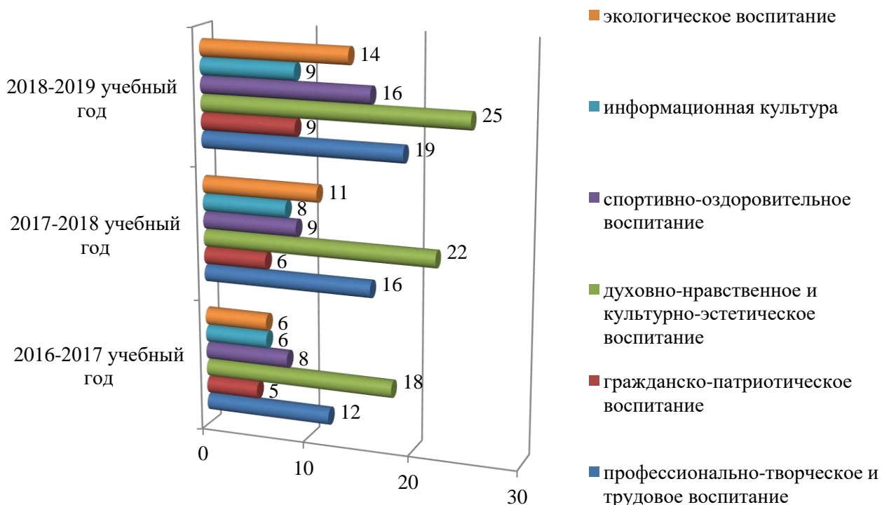
Рис. 2. Количество мероприятий воспитательной деятельности

В деятельности по обучению и воспитанию студентов университета все представленные направления тесно взаимосвязаны, дополняют и обуславливают друг друга.