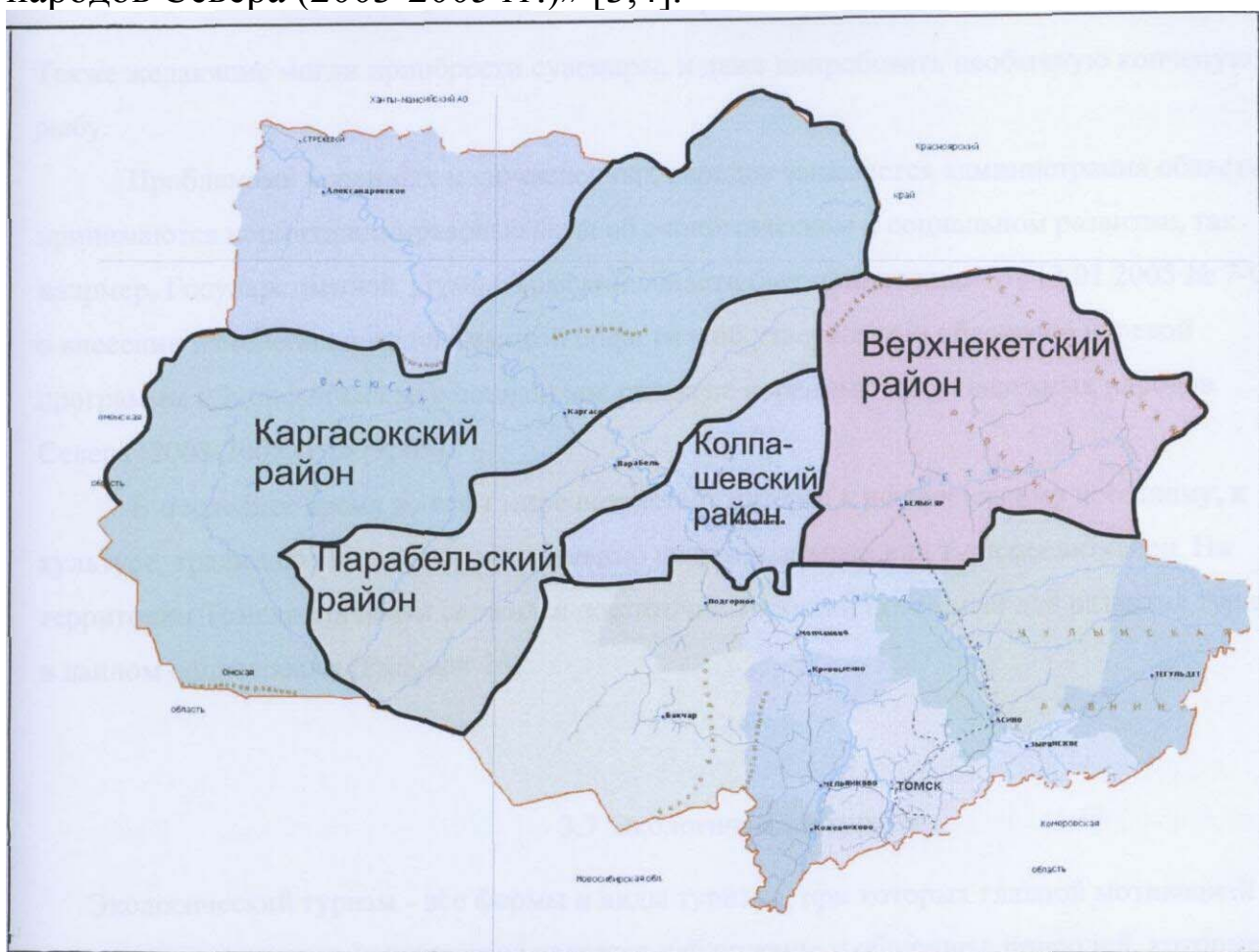
Рис. 1 Туристско-рекреационный потенциал для развития этнического туризма на территории Томской области

Проблемами коренных малочисленных народов занимается администрация Томской области, принимаются нормативно-правовые акты об экономическом и социальном развитии. Так, например, Государственной Думой Томской области был принят закон от 13.01.2005 № 7-03 о внесении изменений в закон Томской области «Об утверждении областной целевой программы «Экономическое и социальное развитие коренных малочисленных народов Севера (2003-2005 гг.)» [3,4].